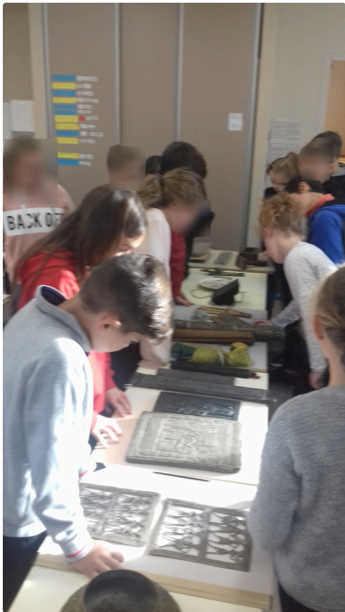
Les élèves se révèlent très intéressés par tout ce qu'ils découvrent.

Katsushika Hokusai a justement besoin d'un petit apprenti. Il va apprendre à Tojiro, en le prenant sous son aile espiègle et moqueuse, le bonheur d'observer la vie et le plaisir de dessiner