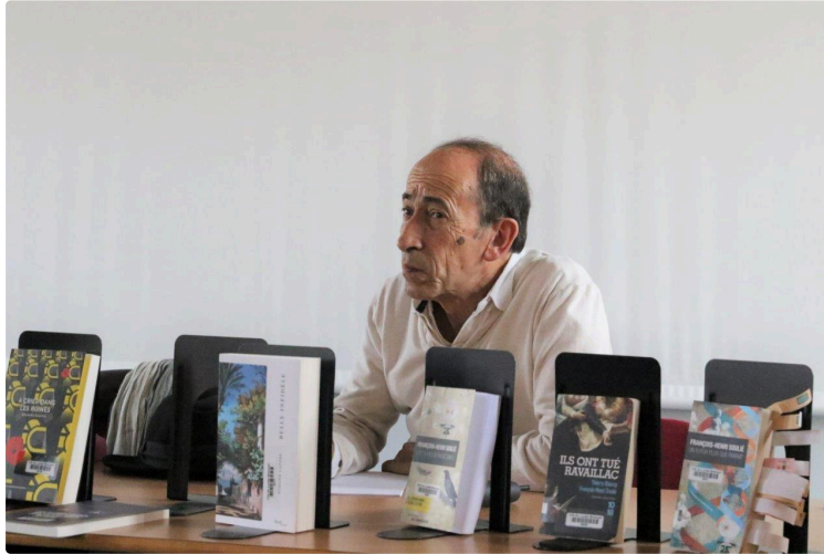
Le lycée Bossuet participe au Prix Jeune Mousquetaire du Premier Roman