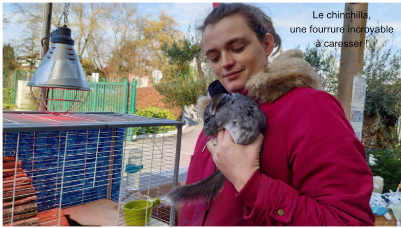
Le chinchilla, une fourrure incroyable à caresser !