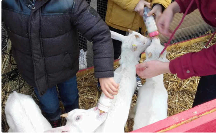
Samedi 7 décembre, journée d'adoption plutôt réussie

Mais fin de semaine, réveil, comme pour beaucoup peut-être, un peu difficile !