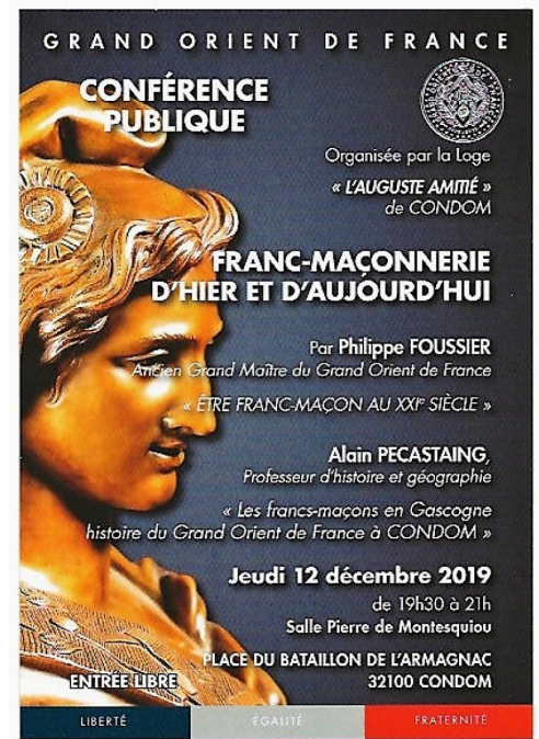
Une conférence de très haut niveau, ce jeudi 12 décembre