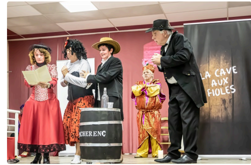
L'arnaque va-t-elle être dévoilée ?...