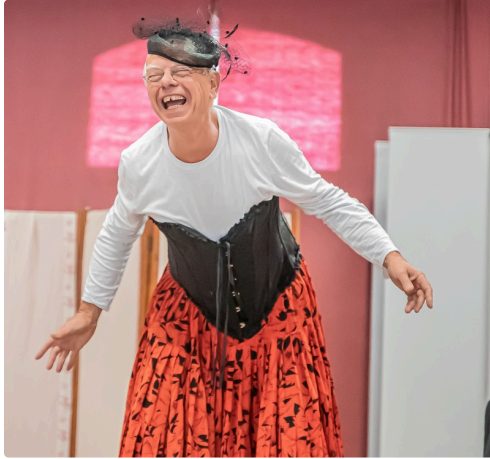
Déguisé en femme