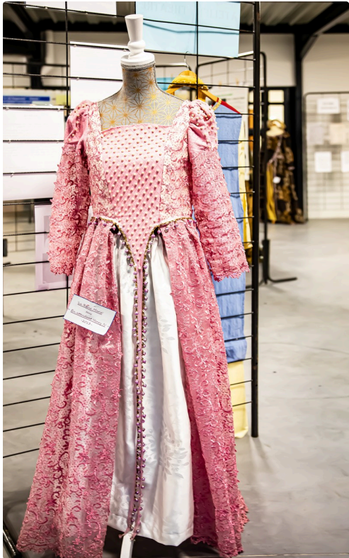
Robe de la reine Marie (En attendant Henri IV)