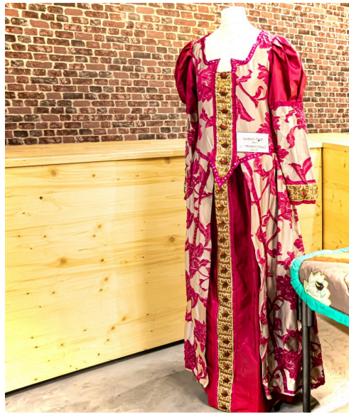
Robe de la reine Margot (En attendant Henri IV)