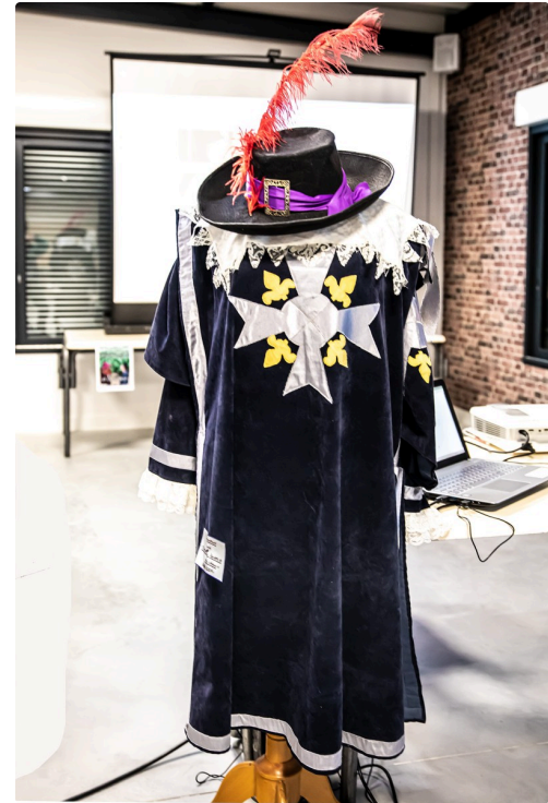
Habit de d'Artagnan (D'Artagnan illustre et mal connu)