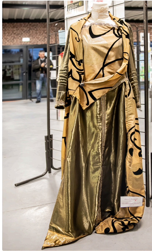
Robe de Jeanne d'Albret (En attendant Henri IV)