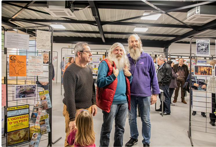
Pour les 40 ans du Clan de Nogaro

Le 29 novembre, Le Centre social et culturel le Clan a fêté ses 40 ans. 40 ans de culture à la campagne avec des conférences et des sorties d'Histoire, du théâtre conçu par l'atelier-théâtre ou joué par lui, d'Aristophane à Labiche. Et le Clan crée, à chaque pièce mettant en scène des personnages historiques, des panneaux clairs et bien documentés qui font le tour des écoles et passent par la salle de cinéma-théâtre.