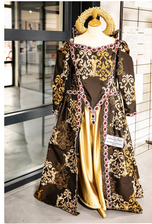
Robe de Catherine Medicis (En attendant Henri IV)