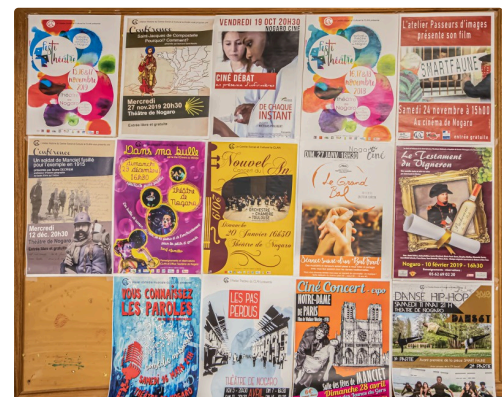
Quelques spectacles organisés par le Clan