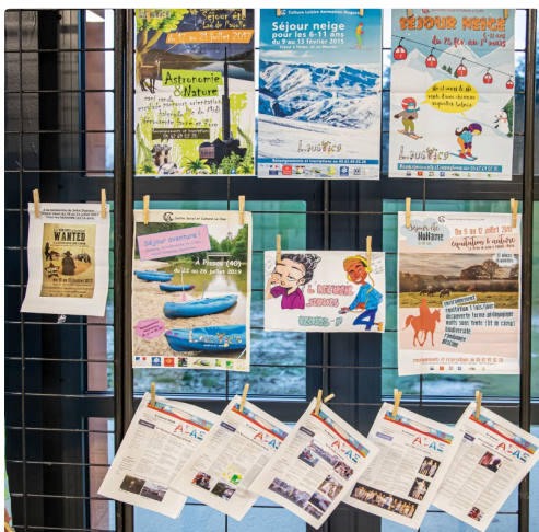
Panneau consacré à l'activité des jeunes

https://lejournaldugers.fr/index.php/article/39345-pour-les-40-ans-du-clan-de-nogaro