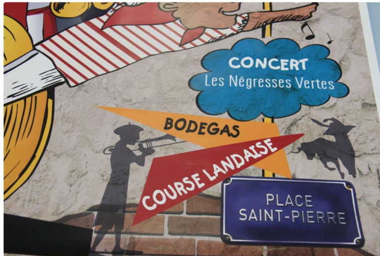
Les Négresses Vertes en tête d'affiche de l'édition 2020 des Bandas

Avec leur musique populaire au confluent des influences méditerranéennes et anglo-saxonnes