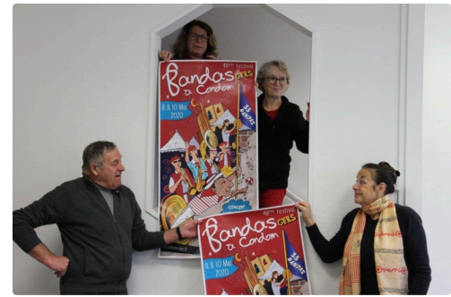
Bandas 2020 IMG_3776.jpg