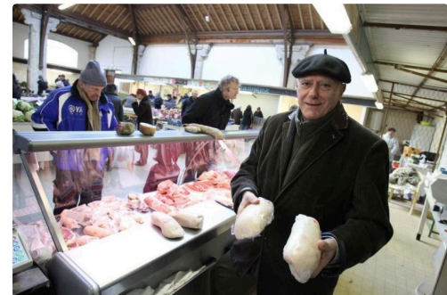
André Daguin au marché de la halle aux herbes, à Auch.