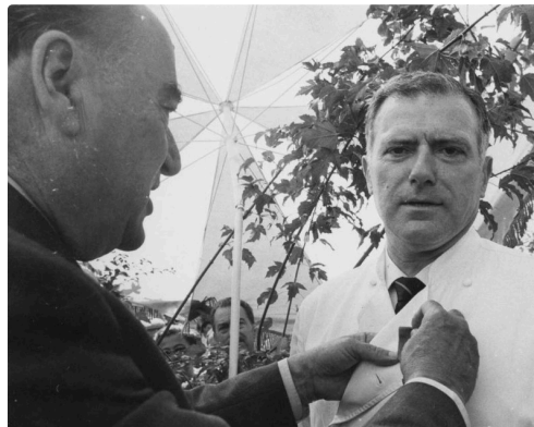
André Daguin reçoit la légion d'honneur des mains de Maurice Faure, le 4 septembre 1988