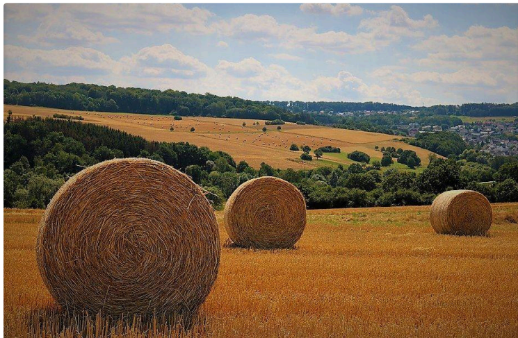
Rendez-vous avec les Bios du Gers-GABB 32

Tous les ans, à l'initiative des Bios du Gers - GABB 32, agriculteurs et professionnels du monde agricole sont invités à venir challenger leurs connaissances et pratiques agronomiques en grandes cultures biologiques.