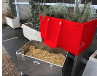
Dans la Ville Rose, on peut faire pipi dans les fleurs