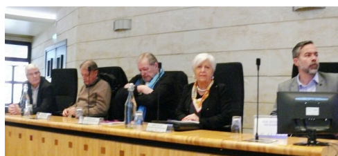
Les principaux acteurs associatifs étaient à la tribune.