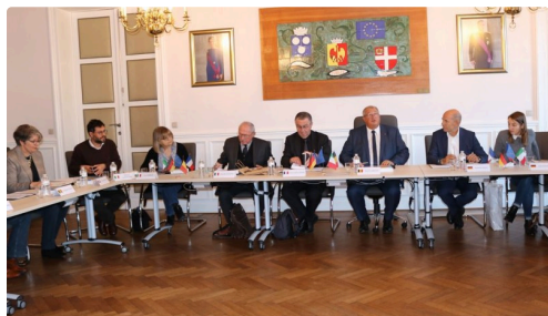
jumelage belgique 2.JPG

La réunion de travail avec les villes de San Mauro Torinese (Italie) et de l'Eliana (Espagne) se déroulera, quant à elle, à l'Eliana, le week-end du 29 & 30 novembre et permettra, de la même manière, d'établir un riche calendrier d'échanges.