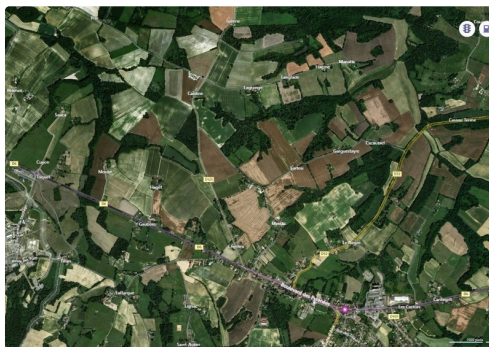
Les alentours du Houga