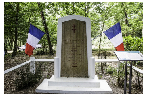
La stèle du bois de Bascaules, à Toujouse