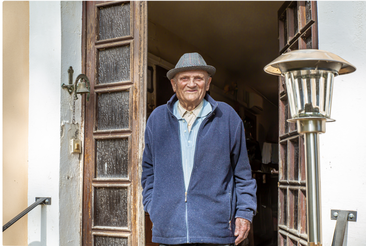
Le 6 août 1944 avec la Résistance aux abords du Houga

Le 6 août 1944 avant l'aube, probablement à la suite d'une dénonciation, les Allemands déclenchent une vaste opération anti-maquis au Houga et dans la campagne environnante.