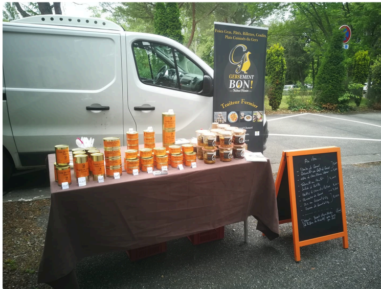
Festival de cane

La cérémonie du « Festival de Cane » a attribué les palmes récompensant les meilleurs producteurs dans la catégorie canard et oie, en attendant l'ouverture du salon Gasconh'à Table dès demain, à partir de 10 h 30 à la halle au gras de Samatan.