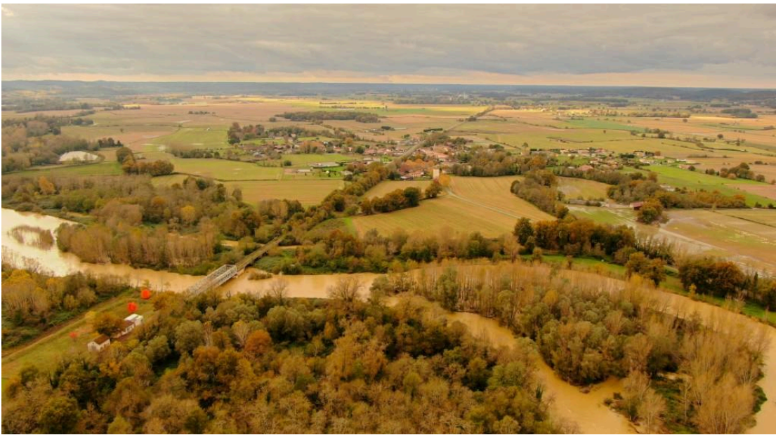
Tarsac toujours cet après-midi