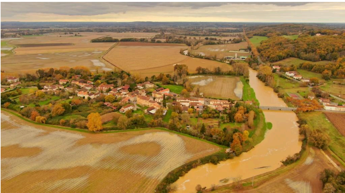
Tasque - L'eau s'amuse à dessiner sur les terres, mais elle déborde...