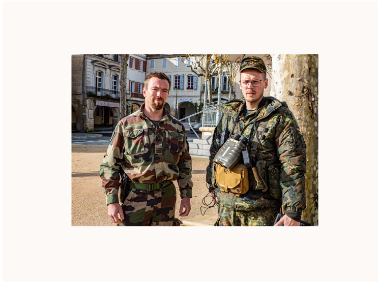
Appui aérien franco-allemand à Vic-Fezensac et à Gondrin

La base aérienne 133 Nancy-Ochey « Henry Jeandet » de l'Armée de l'air dispose d'un CFAA (Centre de formation à l'appui aérien [1]) qui organise, trois fois par an, des sessions de formation pour une vingtaine d'officiers et de sous-officiers des trois Armées, français et allemands (la Bundeswehr ne dispose pas de cette formation). Ils apprennent à guider les aéronefs.