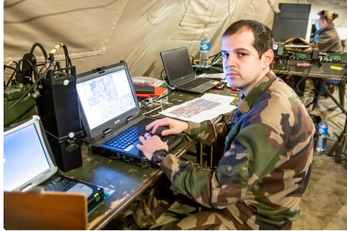
Opérateurs au travail à Gondrin