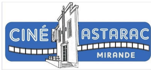
001cinema mirande 2.JPG