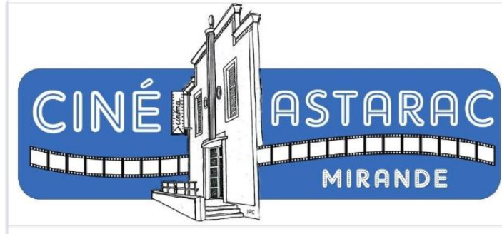
Cinéma de l'Astarac

□ Mercredi 13 Novembre 20h30 : HORS NORMES Comédie de Eric Toledano (1h55min) France / 2019 Avec Vincent Cassel, Reda Kateb, Bryan Mialoundama... Bruno et Malik vivent depuis 20 ans dans un monde à part, celui des enfants et adolescents autistes. Au sein de leurs deux associations respectives, ils forment des jeunes issus des quartiers difficiles pour encadrer ces cas qualifiés "d'hyper complexes"