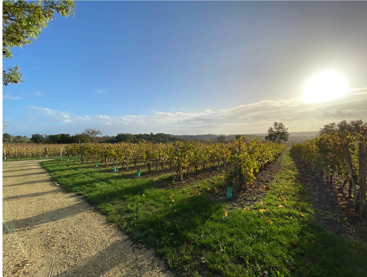
Le vigneron qui fait de sa vie un rêve, et d'un rêve une réalité.

Comme disait Stendhal : La vocation, c'est d'avoir pour métier sa passion. Voici l'histoire d'un jeune qui n'avait qu'une seule idée en tête : devenir vigneron et posséder le plus joli domaine de Gascogne !