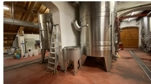
Les cuves du domaine