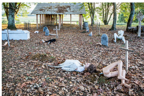
Un cimetière dévasté