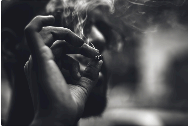
1 mois sans fumer : 5 fois plus de chances d'arrêter