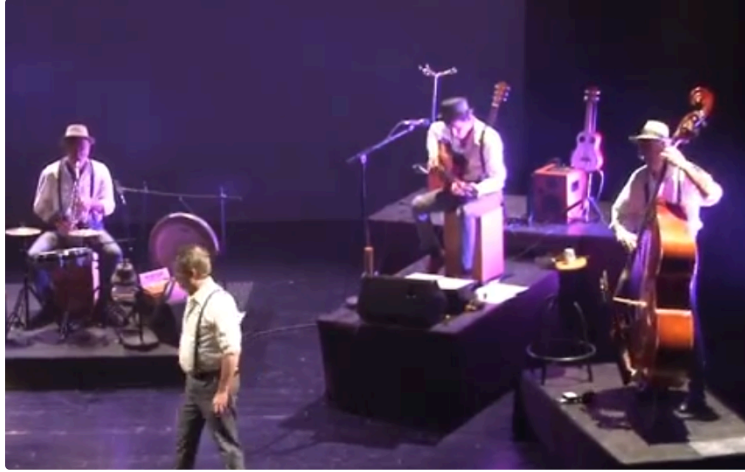
Les pieds dans l'plat dans le Sud-Ouest