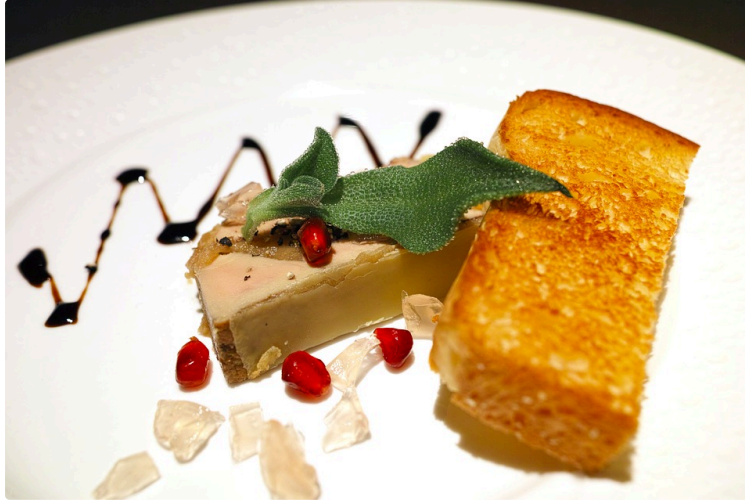
Vers un nouveau label « Foie gras de France »