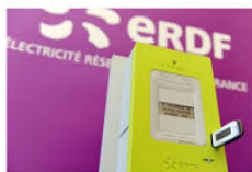
GERS Linky bientôt chez vous