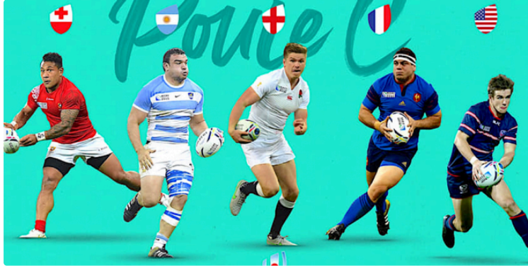
Mondial : les Français doivent bousculer les Tongiens

Pour décrocher un ticket pour les quarts-de-finale du Mondial, les Coqs qui ont fait le boulot lors de leur match contre les États-Unis, partent dimanche à la conquête des îliens.