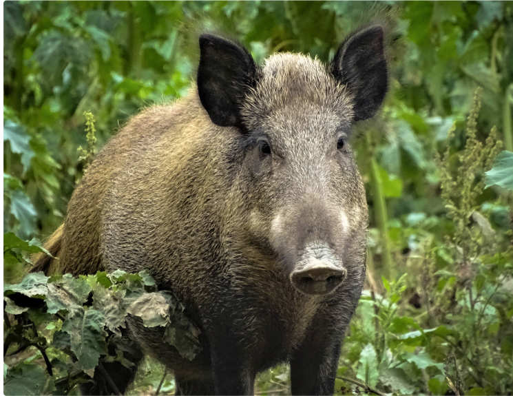
Dossier sangliers : il y a URGENCE !

Depuis le début de l'année 2019, les constats de dégâts de sangliers aux cultures ont explosé sur le plan régional ; le Gers n'est pas épargné, bien au contraire.