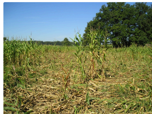
Dégâts de sangliers dans un champ de maïs ; 483 hectares détruits cette année.