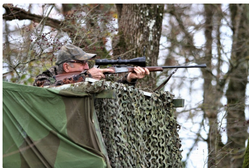
La chasse à l'affût, une des solutions de régulation.