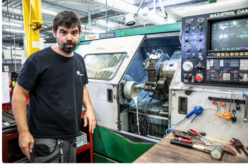
Un spécialiste montre sa machine