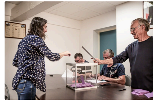
Une des dernières électrices