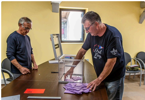
Ouverture de l'urne