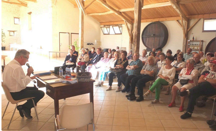
L'Algérie de 1830 à 1962