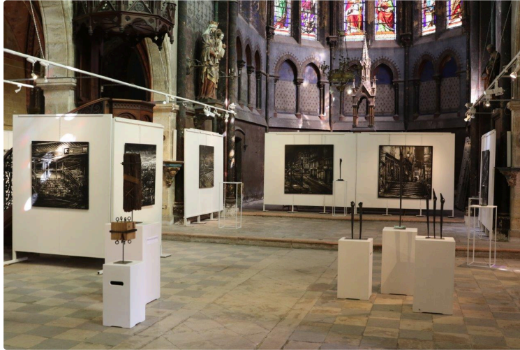
Une exposition à ne pas manquer

... dans le cadre splendide de l'église Saint-Michel