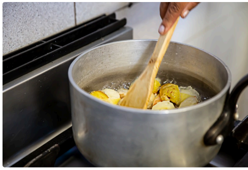
Les pommes sont écrasées