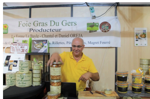
Un « ambassadeur » accueillant

Aujourd'hui, en parallèle de la foire, une fête foraine prend ses quartiers sur la place du foirail.