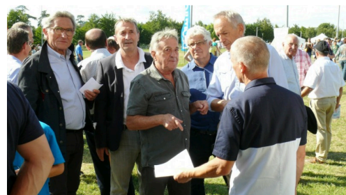
Les officiels sont allés à la rencontre des associations.