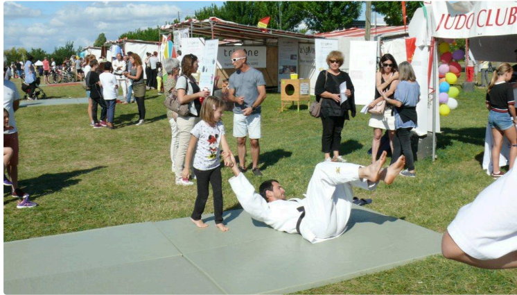
La 40ème foire aux sports et à la culture : un succès qui ne se dément pas

Le rideau est tombé sur la 40ème foire aux sports et de la culture qui s'est déroulée les 7 et 8 septembre, au parc d'Endoumingue. Quasiment une centaine de stands ont occupé le lieu, lesquels reçurent la visite d'environ 7.000 personnes venues découvrir les associations sportives, culturelles et les studios de danse.