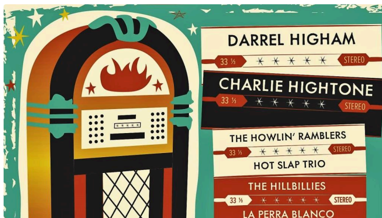
Le festival Rockabilly qui décoiffe

Gomina, jean à revers, corset vichy, perfecto... vous êtes prêts ? Direction le Rockabilly de Tarbes, du 28 août au 1er septembre.