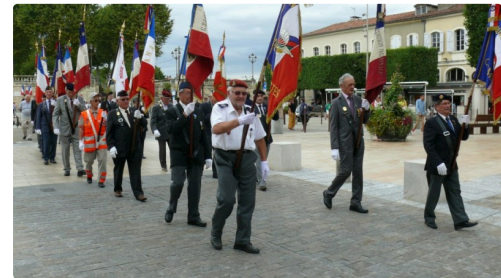
En avant marche, vers le monument aux morts.