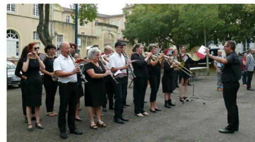
L'ensemble orchestral d'Auch a assuré la partie musicale de la cérémonie.