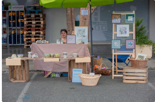
Peintures sur objets