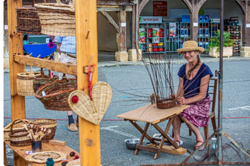
La vannière et ses produits