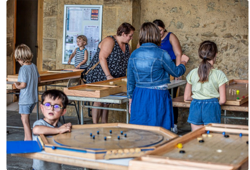
Les jeux en bois n'intéressent pas que les enfants