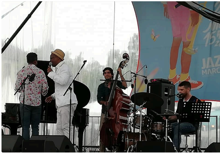
Un tour sur la planète Jazz