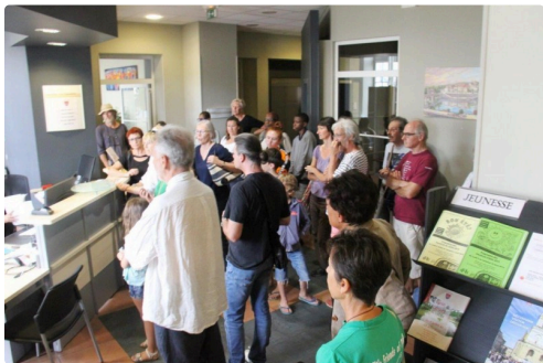
Les membres du collectif dans le hall d'accueil de la mairie.