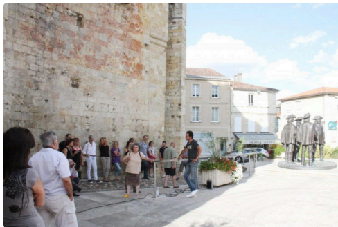
Ils se sont réunis pour mettre un plan d'action en place.