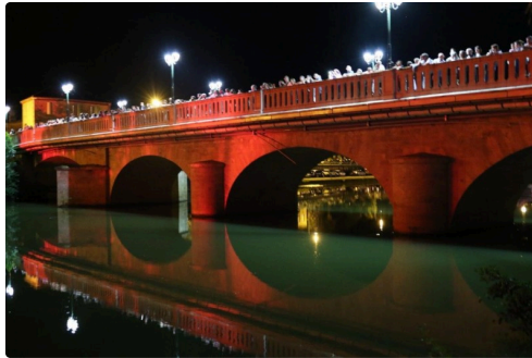
C'est toujours mieux depuis le pont