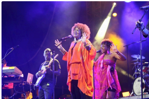
Une énergie XXL