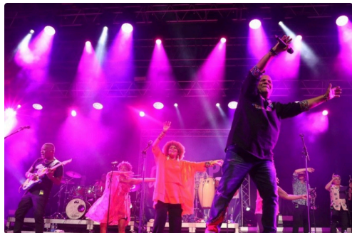
Tous ensemble !