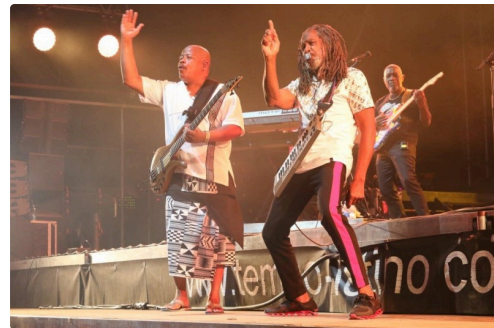
Vous êtes là ?...