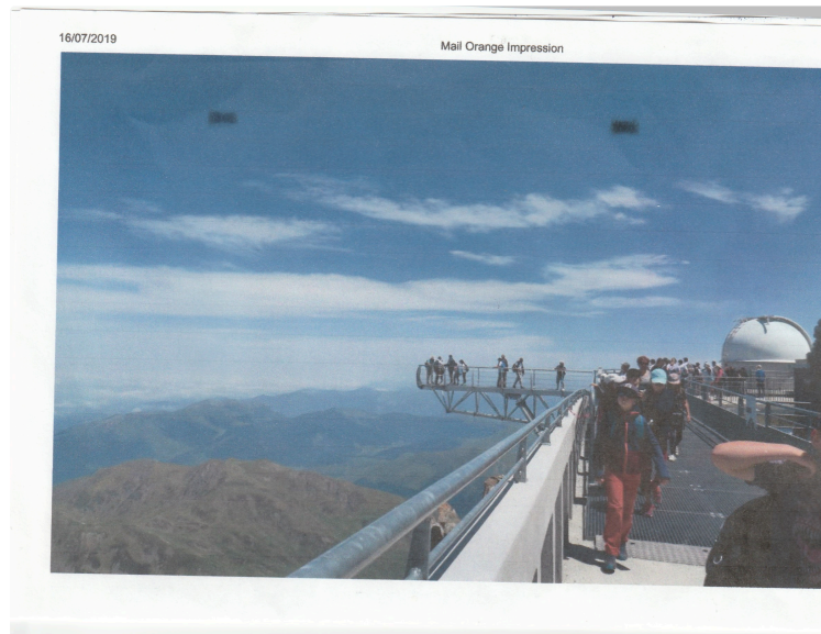
Voyage au Pic du Midi de la FNACA

Par une belle journée d'été, le mardi 25 juin, cinquante adhérents et sympathisants de la FNACA ont pris la direction des Pyrénées pour une visite du Pic du Midi.