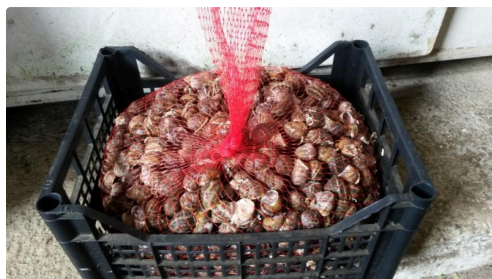
Prêts à trouver acquéreurs ce soir