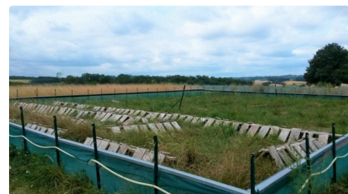
Le deuxième parc au repos pour l'instant