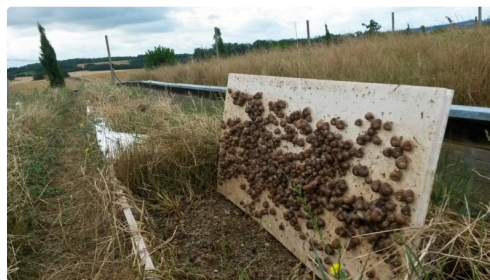
Dérangés dans leur grasse matinée, à l'abri de la chaleur, le temps d'une photo