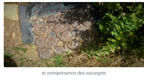
et omniprésence des escargots