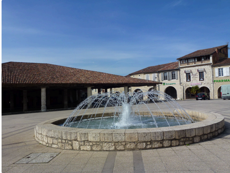
Marché nocturne gourmand : ça commence jeudi 25 juillet !

Cette année, le foyer rural propose trois marchés gourmands. Ce sera l'occasion d'innover avec deux artistes et une banda.