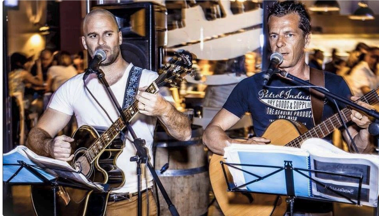
LA fête reprend des couleurs

La fête du village de Saint-Élix-Theux revient pour une nouvelle édition. Après deux saisons d'absence, le comité des fêtes, enthousiaste grâce à l'arrivée de nouveaux membres, organise la fête locale le 20 juillet dans une salle des fêtes entièrement rénovée.