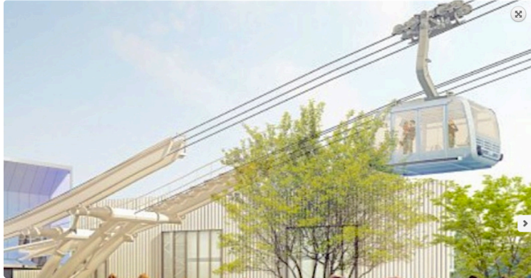
La ville rose aura son téléphérique

On pourra traverser Toulouse dans les airs dès la fin 2020