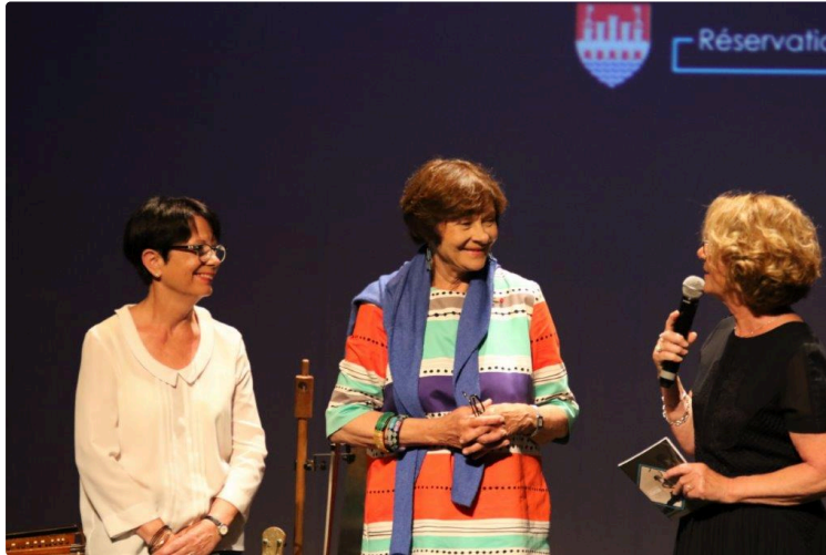
La nouvelle saison culturelle dévoilée

En présence de Macha Méril, la marraine du Théâtre des Carmes