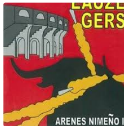
Places offertes pour le Trophée Occitanie lors de la feria

La Coordination des Clubs Taurins de Nîmes et du Gard organise le trophée Occitanie.