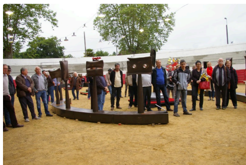
Public d'aficionados pour le vernissage