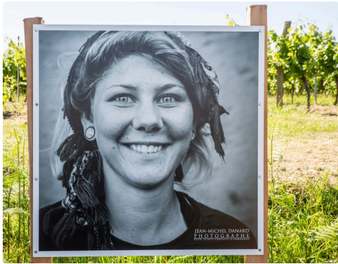
8 Un portrait 1bis 160619.jpg