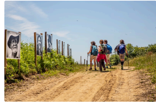
Deux jours avant l'inauguration, des pèlerins face aux photos de pèlerins