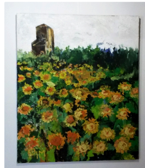
Le Gers et ses tournesols - Photos M.F.