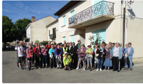
Un début de week-end de Pentecôte déjà bien animé !

Tout d'abord, vendredi 7 juin, le week-end débute avec la troupe de Théâtre des Truculents Gascons. Ils ont proposé le fruit de leur travail annuel aux habitants de Roquelaure.