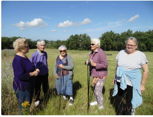
Un mini groupe sur le plateau de la Cioutat, au pied du château d'eau et du moulin à vent.